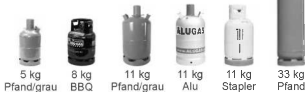
5 kg Pfand/grau 8 kg BBQ 11 kg Pfand/grau 11 kg Alu 11 kg Stapler 33 kg Pfand